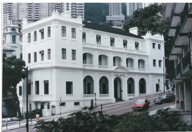
梅夫人婦女會大樓外觀

梅夫人婦女會會址座落於中環花園道，在第二次世界大戰期間曾相繼被日軍及英軍徵用，其後於 1947 年重新歸梅夫人婦女會所有。由於會址大樓歷史悠久，其主樓外部於 1994 年更被香港政府列為法定古蹟，可見其建築特色及價值。