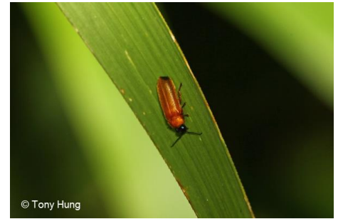
進行生態調查時，參加者有機會遇到罕見的米埔曲翅螢

米埔自然保護區 1 為雀鳥及多類本地生物提供重要的居所。為維持保護區內的生物多樣性，我們必需了解區內的狀況，以便管理並防止濕地及依賴其維生的物種，因人類活動或其他原因而漸漸消失。世界自然基金會香港分會(WWF)於 2017 年起舉辦本計劃，讓青年有機會成為「公民科學家」，和 WWF 職員一同參與生態調查及研究。今年香港女童軍將參與其中，招募會員參與計劃。